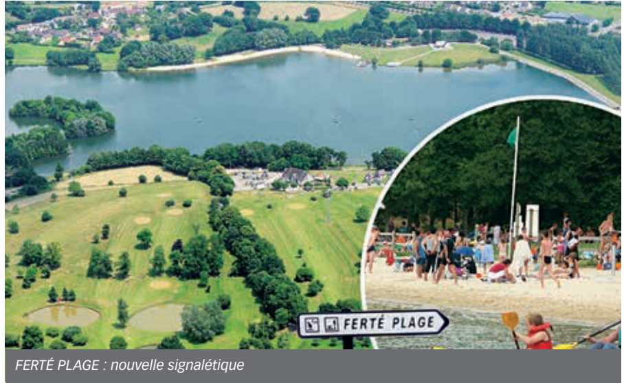
FERTÉ PLAGE : nouvelle signalétique

Classé en 2 e catégorie, la pêche est autorisée dans une zone réservée, avec un empoisonnement régulier et des animations par l'AAPMA Fertois dont l'enduro-pêche du 17 au 19 mars et une seconde édition en octobre. La baignade est surveillée en juillet et août.