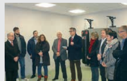
Cyrille Marquet (2 e à partir de la gauche), un parrain olympique pour la nouvelle salle d'arts martiaux.

L'inauguration s'est déroulée le 21 décembre en présence des élus locaux et du judoka Cyrille Marquet, médaillé de bronze en moins de 100 kg aux Jeux Olympiques de Rio 2016.