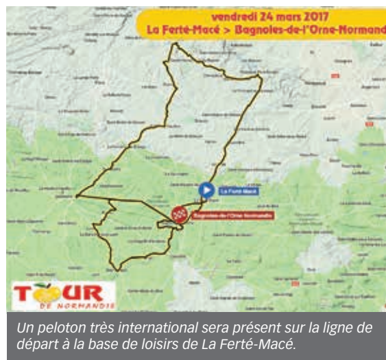
Un peloton très international sera présent sur la ligne de départ à la base de loisirs de La Ferté-Macé.

En quelques chiffres, le Tour rassemble un peloton de 144 coureurs répartis sous 24 équipes, 120 véhicules dans la course, une escorte de la Garde Républicaine de 26 motards et 1 100 signaleurs dans les carrefours.