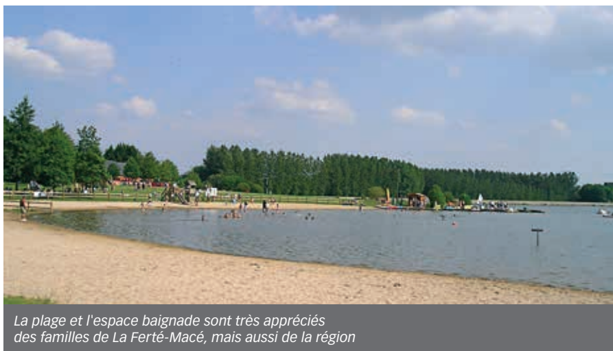
La plage et l'espace baignade sont très appréciés des familles de La Ferté-Macé, mais aussi de la région

La municipalité a décidé de confier la gestion de certains équipements à des structures associatives ou privées : le swin-golf, le bar de la plage, la pêche, les pédalos, les rosailles, et prochainement le centre équestre. Cela apporte plus de souplesse dans la gestion, permettant ainsi un développement de ces activités et en même temps une réduction des dépenses pour la collectivité. Une aire d'accueil pour campings car ouvrira cet été.