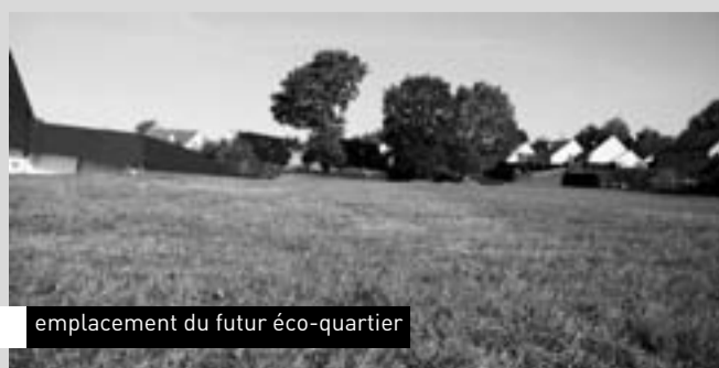
emplacement du futur éco-quartier

Voilà donc un ensemble de propositions susceptibles de répondre, à la variété de la demande. ■