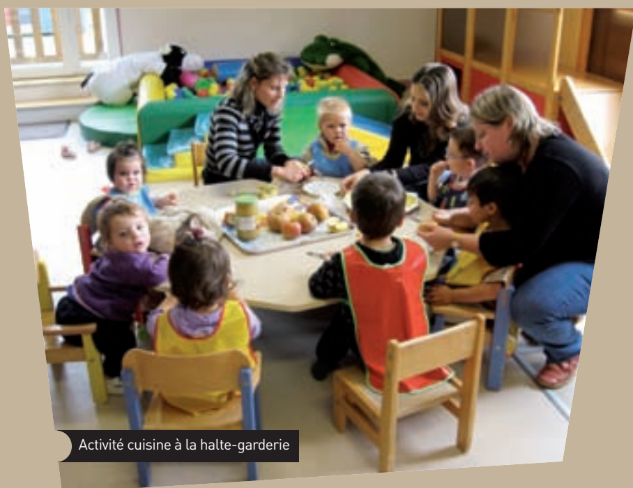
Activité cuisine à la halte-garderie

Le Service Petite Enfance comprend quatre composantes distinctes :