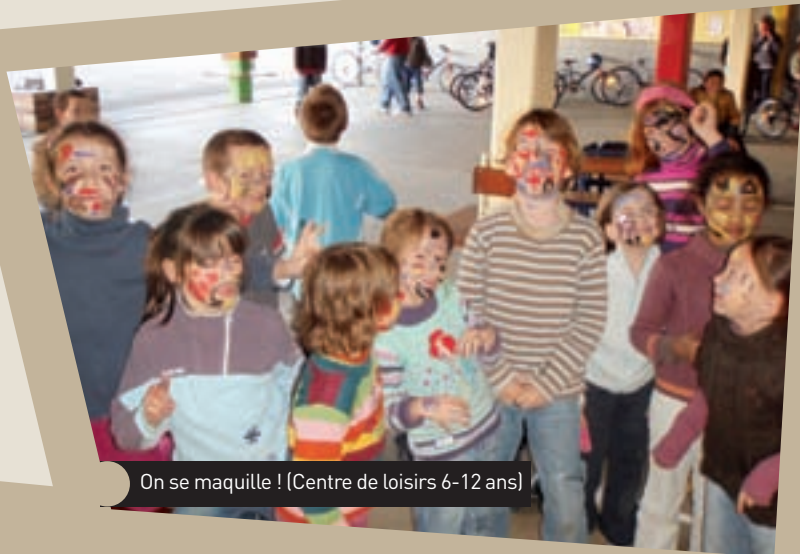
On se maquille ! (Centre de loisirs 6-12 ans)

rés par groupes d'âge. L'espace d'accueil est aménagé en fonction de leurs besoins, de leur rythme et des activités proposées. »