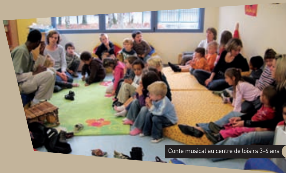
Conte musical au centre de loisirs 3-6 ans

Deux centres de loisirs coexistent sur la commune :