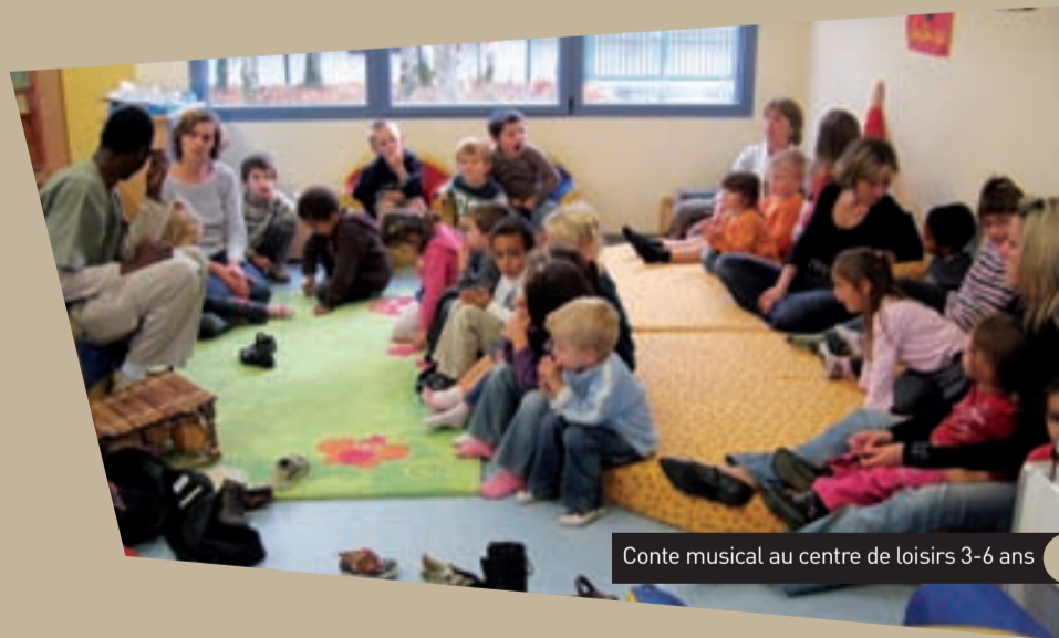
Conte musical au centre de loisirs 3-6 ans

Deux centres de loisirs coexistent sur la commune :