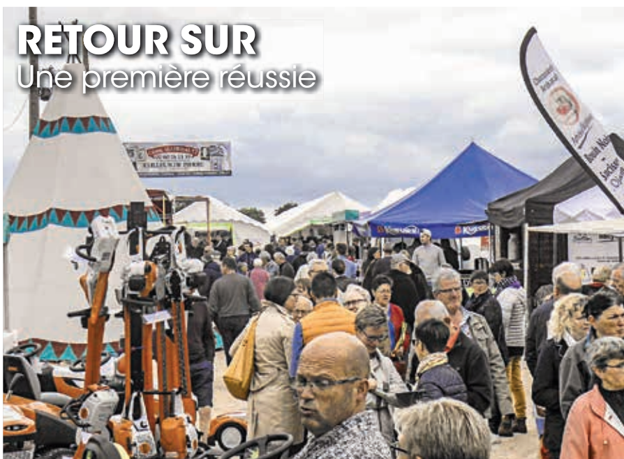
La Ferté-Macé Foire-Expo/Fête du jeu, succès de la première au stade Gaston-Meillon les 25 et 26 mai derniers.

Après une interruption de deux ans, le salon de l'habitat devenu La Ferté-Macé Foire-Expo a attiré les professionnels de l'habitat, de l'artisanat, de la gastronomie, du plein air... Cette première foire-expo a connu un réel succès tant auprès des professionnels que des visiteurs venus nombreux.