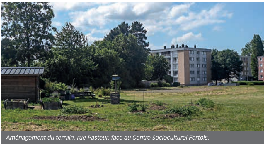
Aménagement du terrain, rue Pasteur, face au Centre Socioculturel Fertois.