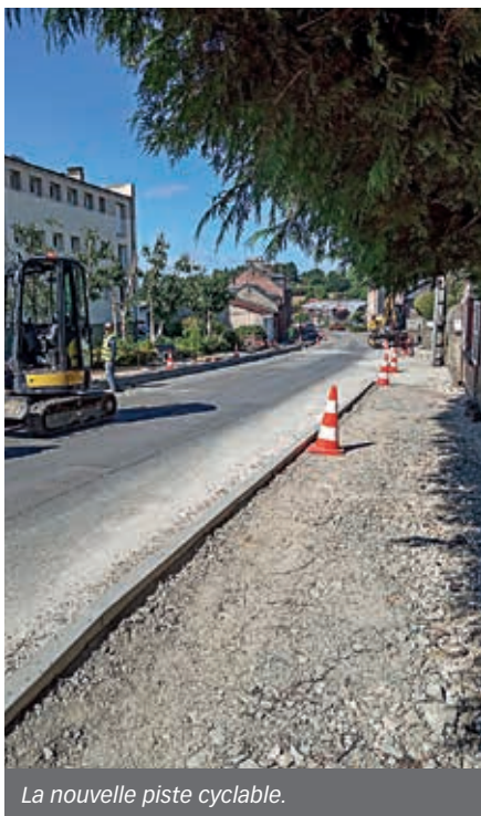
La nouvelle piste cyclable.

Pour rappel, ces équipements s'inscrivent dans le cadre des TEPCV (Territoires à énergie positive pour la croissance verte) pour un montant de 280 000 € HT dont 200 000 € de subventions. Pour compléter ces aménagements, le réseau