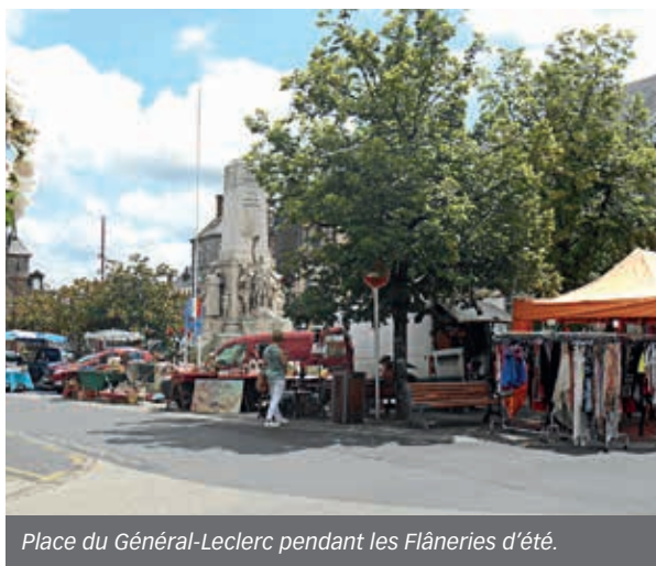
Place du Général-Leclerc pendant les Flâneries d'été.

Comme de nombreuses autres villes de taille identique ou supérieure, La Ferté-Macé est confrontée à la fermeture de commerces. Le centre-ville reste malgré tout la première zone d'emplois avec ses commerces, ses services, ses associations et différentes structures. On trouve à peu près tout dans le centre-ville : des magasins d'alimentation et magasin bio ; des restaurants et bars... la vente de vêtements (un petit clin d'œil au magasin Latitude qui vient d'agrandir sa surface de vente !), de chaussures, bijouterie, des salons de coiffures, des magasins d'optique, d'appareils auditifs, magasin d'électroménagers et multimédias, etc. Un grand soulagement pour tous car la Maison de la Presse vient d'être reprise. Nous nous réjouissons de cette bonne nouvelle et