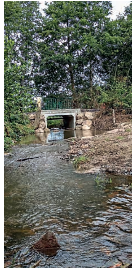
Le Pont Chapelle après les travaux de réfection.

il a fallu dégager la canalisation et protéger le fourreau en fonte par un coffrage en bois.