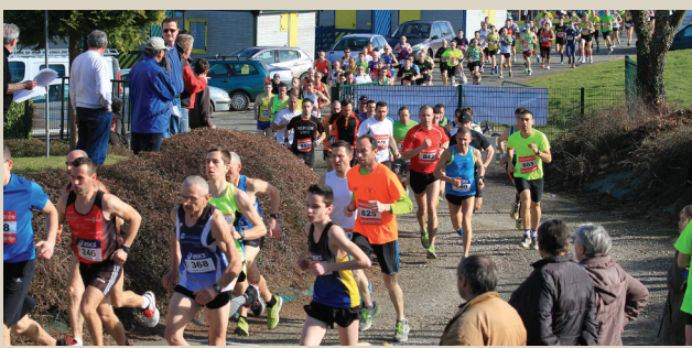
25 e Course de Printemps (200 participants). ■