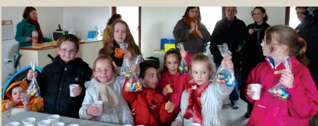
Chasse aux œufs à la base de loisirs. ■