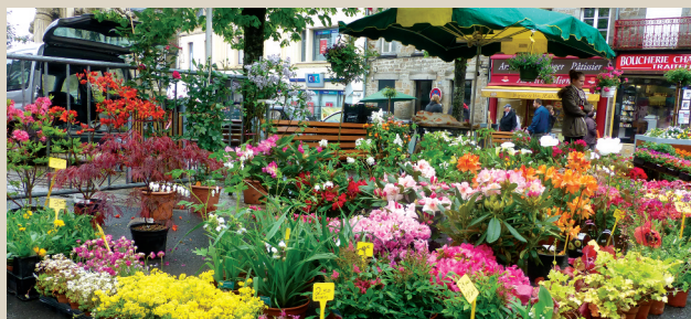
Marché aux fleurs – Exposition de voitures anciennes et de bonzaïs. ■