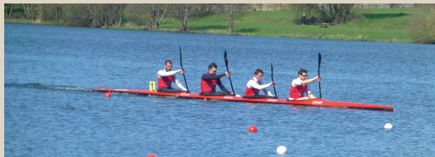
Championnat de Normandie de Canoë-Kayak à la Base de loisirs. ■