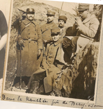
Dans la tranchée fin de Bray-sur-Somme.