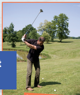
Championnat de ligue Swin Golf.