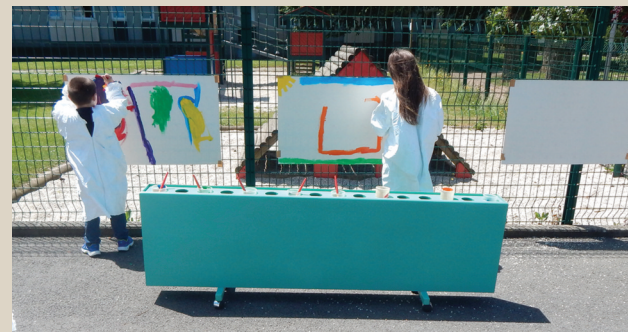
Fête du Centre Socioculturel fertois. ■