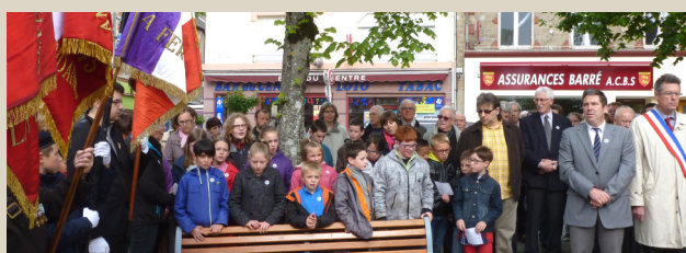
Commémoration du 70 e anniversaire de la fin de la guerre 39/45 et du 61 e anniversaire de la fin du conflit indochinois. ■