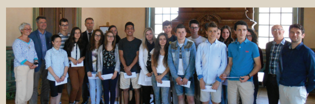
Remise des prix de la Résistance et de la déportation. ■