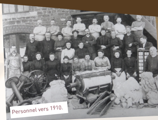
Personnel vers 1910.