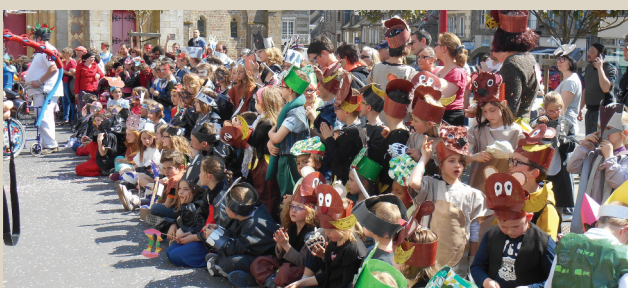
Carnaval des écoles. ■