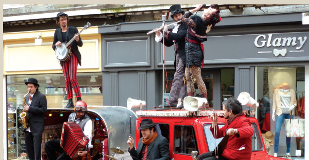
Les Andain'ries déambulation dans les rues de la ville par la Cie du P'tit vélo. ■