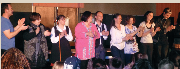
Les habitants du Quartier J. Prévert sur les planches. ■