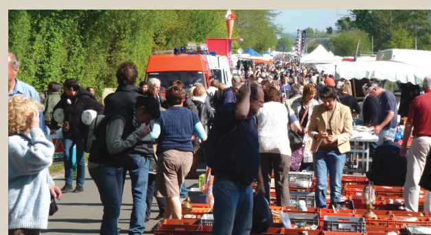
Foire des Andaines à St Michel-des-Andaines. ■