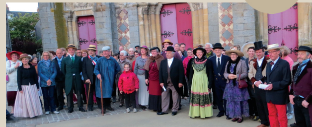
Pierres en lumières. ■