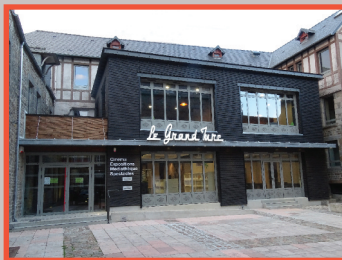
Le Grand Turc