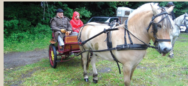
Journée nature. ■