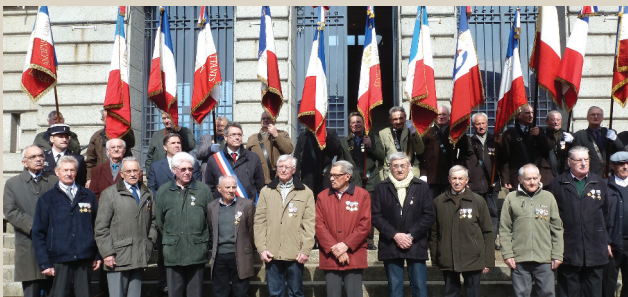
Dix anciens d'Afrique du Nord décorés.

Commémoration du 53 e anniversaire du 19 mars 1962 « Cessez le feu » en Algérie. ■