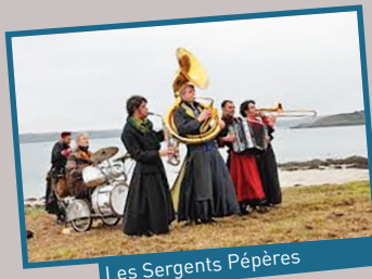
Les Sergents Pépères