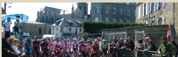
Prix de la municipalité. Organisé par le Vélo Club Fertois. ■