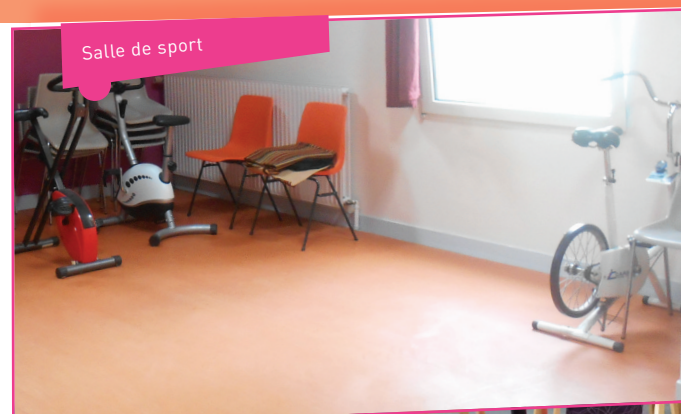
Salle de sport

Pour faciliter l'accès à l'information et améliorer l'accompagnement des demandeurs d'emploi et des entreprises dans leurs projets, l'agence de proximité de La Ferté-Macé quitte ses locaux pour intégrer un nouveau bâtiment au 1, cour Saint-Denis. ■