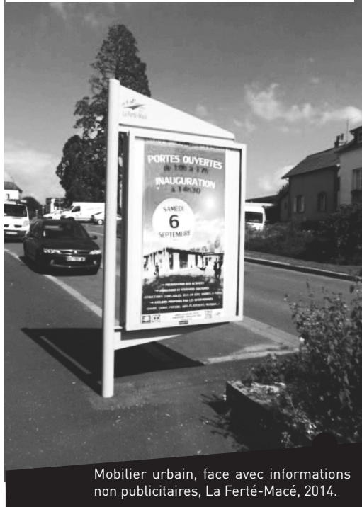
Mobilier urbain, face avec informations non publicitaires, La Ferté-Macé, 2014.