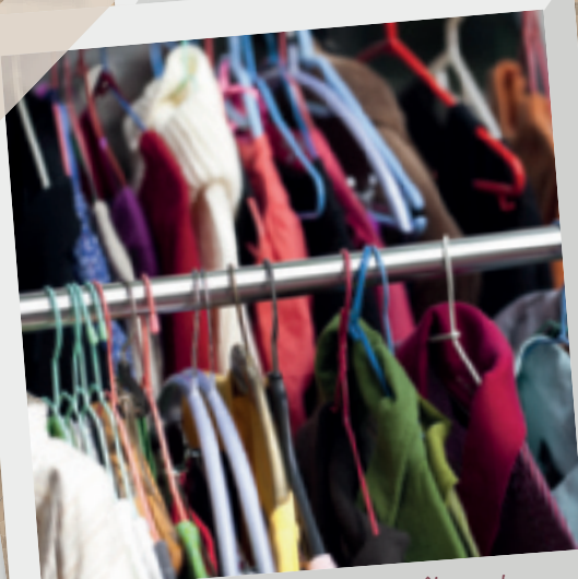
13-14 février • Bourse aux vêtements. Association des familles.