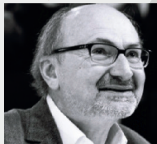
22 mars • Conférence d'Eric Fottorino « Liberté de la presse où en est-on ? ».