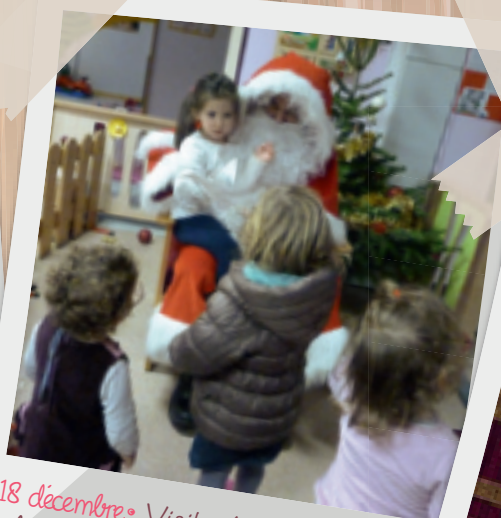
18 décembre • Visite du Père Noël à la maison de la petite enfance.