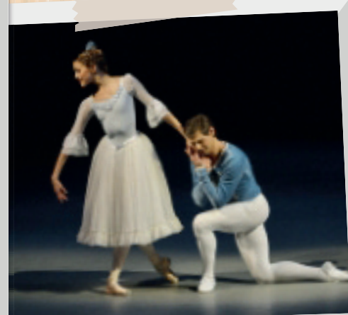
4 mars • Ciné Opéra, salle G. Philippe, retransmission du ballet « Casse-Noisette » en 3 D.