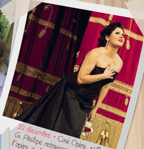
30 décembre • Ciné Opéra, salle G. Philippe retransmission de l'opéra « Jeanne d'Arc ».