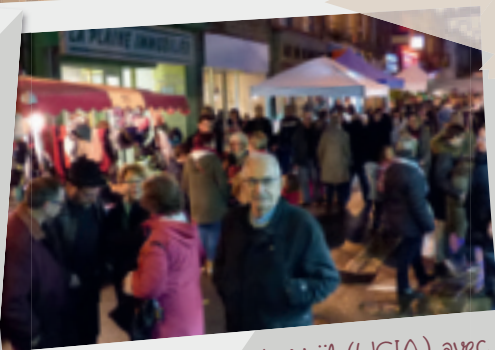
16 décembre • Marché de Noël (UCIA) avec la participation d'associations locales : environ 70 exposants nous ont proposé des produits du terroir et de l'artisanat. L'association des familles « la marmite des familles » proposait des dégustations de soupes avec la recette, l'association Anim'Ferté quant à elle nous a permis de savourer des gâteaux.