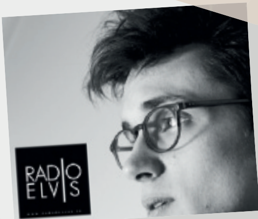
11 mars • Radio Elvis en concert. Un public conquis.