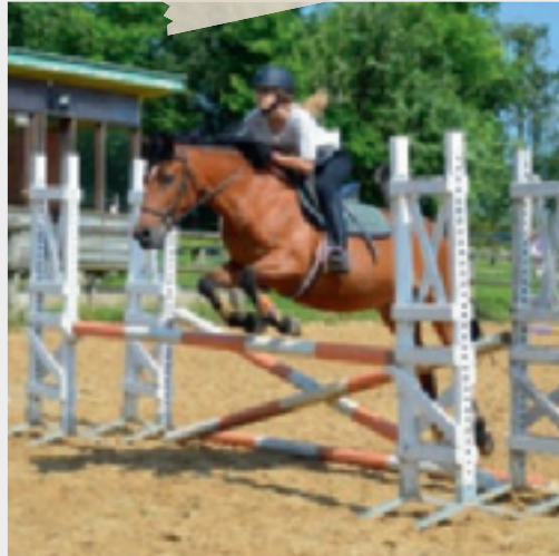
8 au 19 février • Stage équitation au Centre Équestre La Péleras.