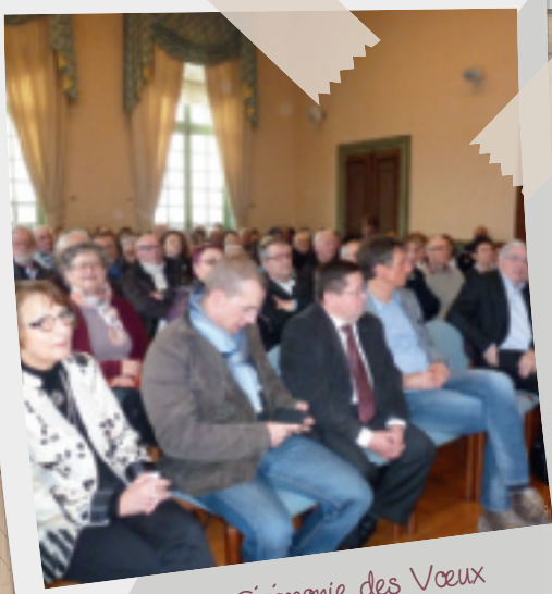
23 janvier • Cérémonie des Vœux à la population.