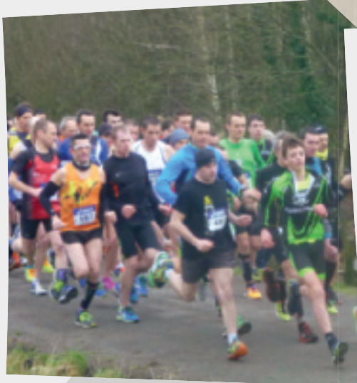
5 mars • 200 coureurs ont affronté le froid pour cette course de printemps (Jogging d'Andaine).