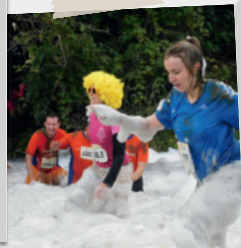
17 septembre • Incendiaire Acte IV.