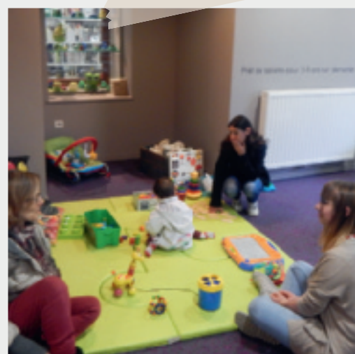
Du 21 au 26 novembre • Semaine de la parentalité.