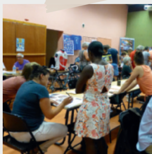
2 septembre • Forum des associations.