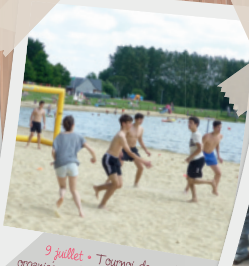
9 juillet • Tournoi de sand ball organisé par l'Amicale Fertoise Hand.