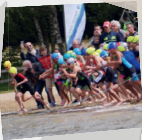
2 et 3 juillet • Surviv'Orne.