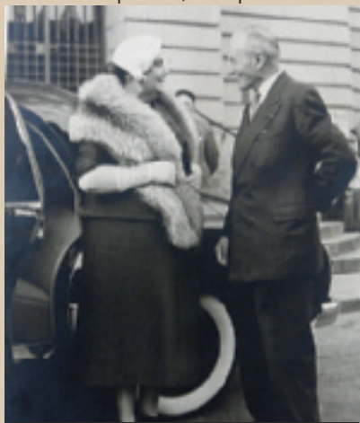
Mme Coty, épouse du président de la République et monsieur Meillon en 1954.

de l'Orne lors de l'élection d'octobre 1947. À La Ferté-Macé, elle triomphe avec à sa tête Gaston Meillon. Âgé de 86 ans, il ne se présente pas lors de l'élection municipale de mars 1971 et quitte la scène publique. À une question du quotidien Ouest-France sur la raison de sa longévité d'homme public, il répond : « J'ai fait de l'administration, non pas de la politique » et concernant son bilan des dernières années : « Un programme de 1 900 logements dont 600 réalisés, une tranche de 87 pavillons terminés (C.I.L.), l'industrie représentée par 13 entreprises dont six entreprises décentralisées (parmi celles-ci : Manuplast implantée à Fimbrune en 1966, la création de 290 em-