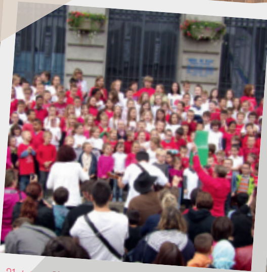
21 juin • Fête de la musique, chorale des élèves des Écoles P. Souvray et Ch. Perrault.