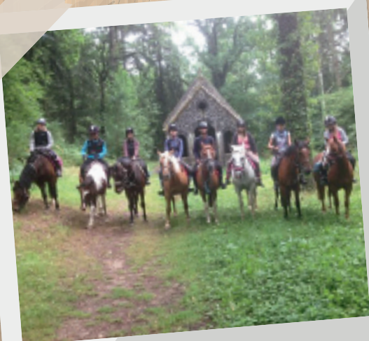
20 août • Centre équestre La Péleras, randonnée.