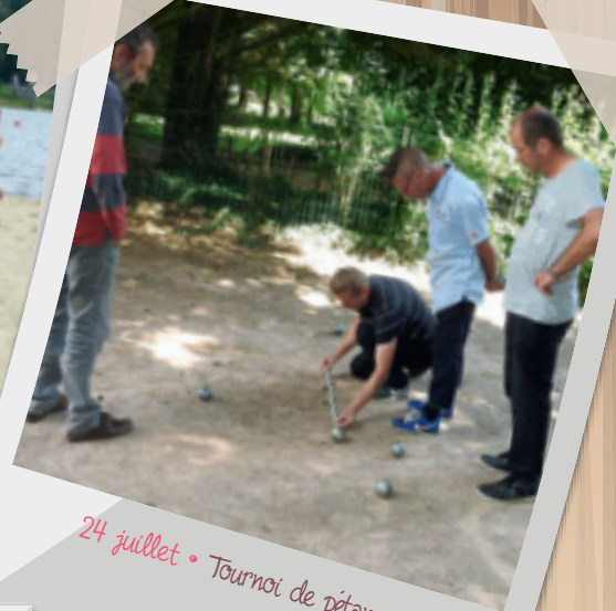
24 juillet • Tournoi de pétanque.