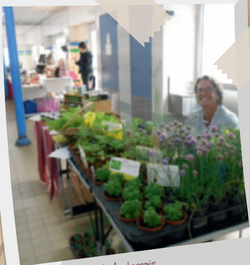
5 août • Marché du terroir.