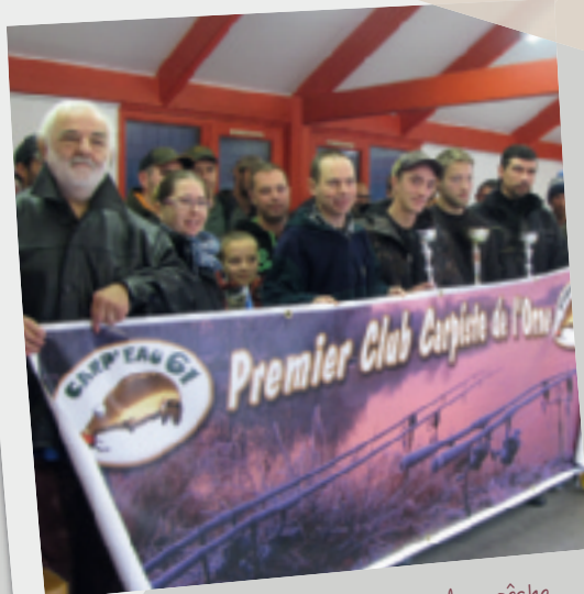
15 et 16 octobre • Carpiéau 61 enduro pêche. Remise d'un chèque de 500 € en faveur du Téléthon.