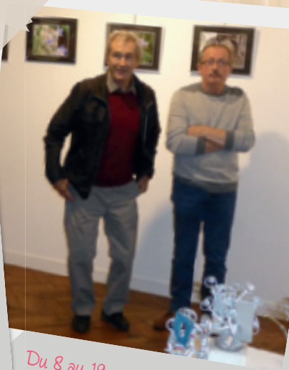
Du 8 au 19 novembre • Exposition Roger Bidault et Jacky Requena.