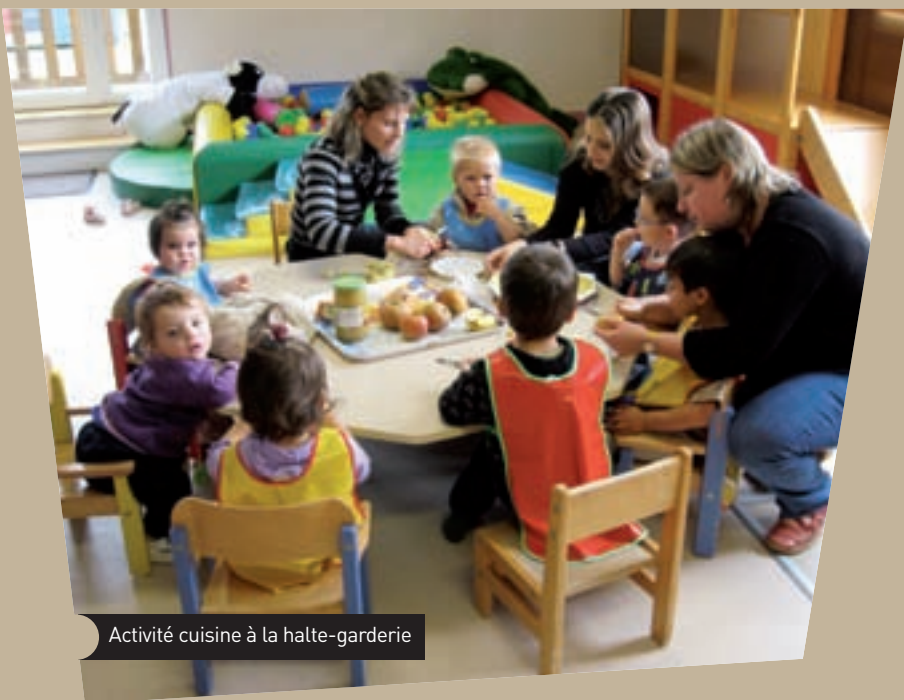
Activité cuisine à la halte-garderie

Le Service Petite Enfance comprend quatre composantes distinctes :