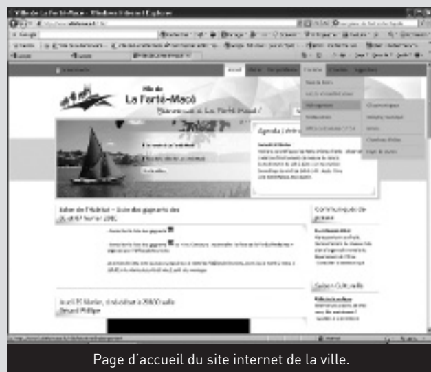
Page d'accueil du site internet de la ville.

Une nouvelle version du site internet de la ville de La Ferté-Macé est en ligne depuis le 1 er février 2010.