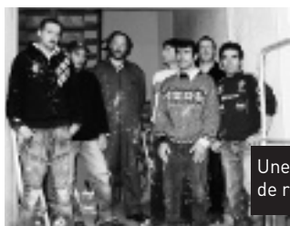
Une partie de l'équipe du chantier de rénovation.

11 personnes ont été inscrites dans le dispositif, dont 5 habitants du quartier. Les employés ont été embauchés dans le cadre de contrats d'insertion : Contrat d'Avenir (CAV) ou Contrat d'Accompagnement à l'Emploi (CAE) pour une durée de six mois, sur la base