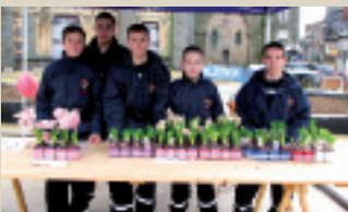
Les jeunes sapeurs pompiers ont participé pour la première fois au Téléthon.

Puis les enfants de l'école Ste-MARIE ont procédé à leur marche « au pas de course » autour de la mairie.