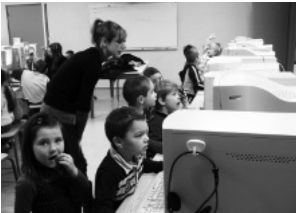
Dans le cadre de la liaison Maternelle-CP : les grandes sections en atelier informatique à l'école primaire.

L'école maternelle J.-Prévert est attentive à développer un vrai partenariat éducatif. Son projet d'école précise ses priorités : « renforcer les liens école-famille » grâce au dispositif passerelle qui contribue à établir des relations, mais aussi en mettant en place un accueil privilégié, une communication renforcée... et de nombreuses activités qui favorisent l'ouverture. Elle est attentive également à la liaison Grande Section (GS)-Cours Préparatoire (CP) en menant des projets communs avec le primaire comme celui de « éco-école ».