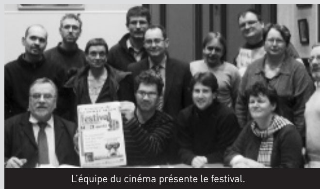
L'équipe du cinéma présente le festival.

Le cinéma en 3D : les films sont réalisés avec des caméras dotées de deux objectifs espacés d'environ 6 cm (comme le sont séparés nos yeux)