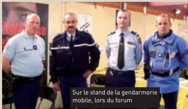
Sur le stand de la gendarmerie mobile, lors du forum