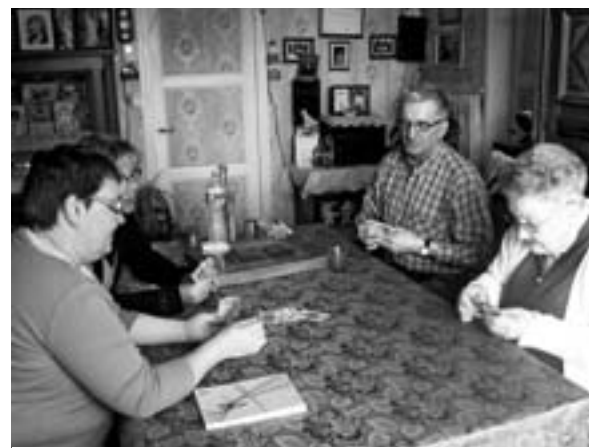
Trois bénévoles jouent aux cartes avec une bénéficiaire des visites de courtoisie