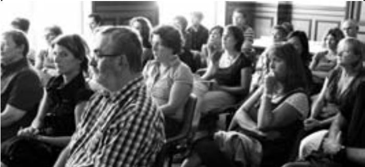
Les enseignants ont été reçus en mairie, afin de faire le point sur la rentrée dans les écoles fertoises.