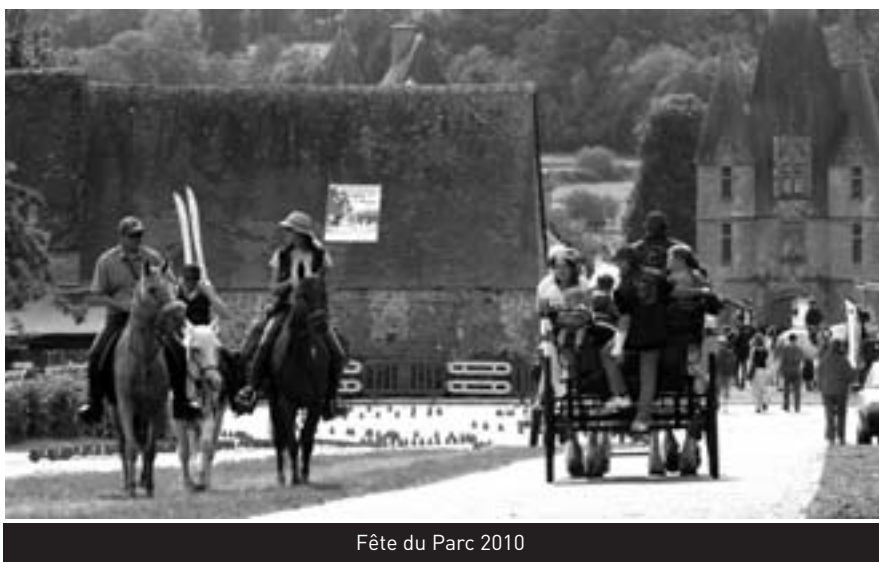
Fête du Parc 2010