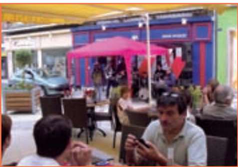
Chaque année, pendant la période estivale, le magasin Isis, le Bar du Centre et la Taverne de la Paix organisent un ou deux concerts, rue de la Victoire