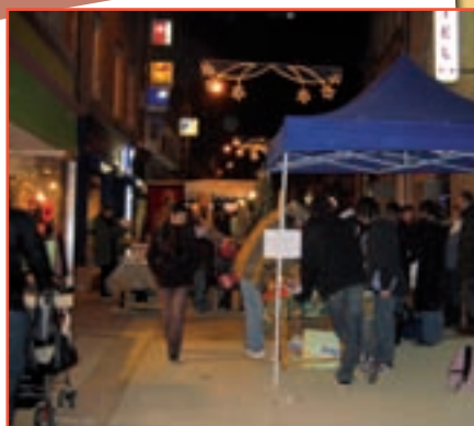
Marché de Noël (décembre 2009)

Ils déplorent les problèmes de stationnement sur la place et se déclarent tout de même inquiets pour l'avenir des petits commerces en centre-ville.