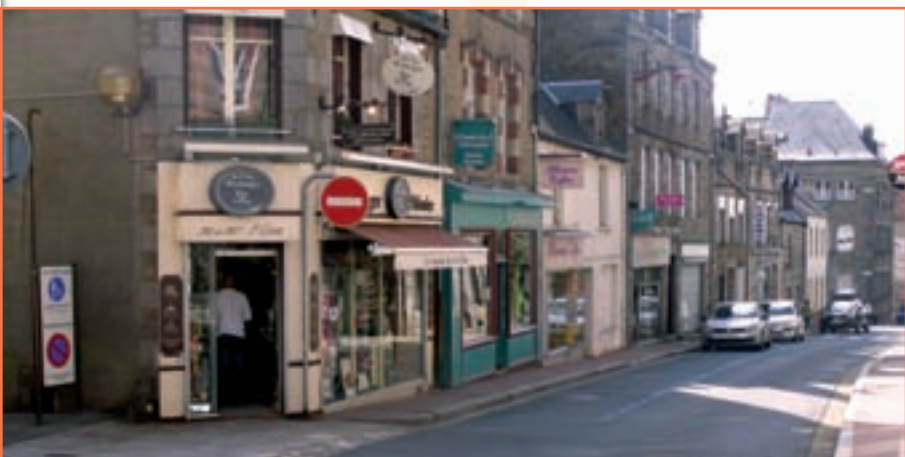
Rue de la Barre

La responsable de Latitude , magasin de vêtements, place Leclerc, nous confie ses difficultés lors de son installation (pendant la crise et les travaux du parvis sur la place). Le magasin est ouvert depuis le 1 er février 2009.