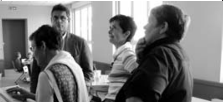
Visite des élus fertois au restaurant scolaire rénové de l'école Paul Souvray, lors de la rentrée scolaire.

Notre ville a toujours eu beaucoup d'ambition pour ses écoles. C'est pourquoi tourner la page « Charlie CHAPLIN » a représenté une décision particulièrement douloureuse. Mais dans le souci, vu les effectifs, de jouer l'avenir, il était sage de fusionner deux écoles maternelles, créant ainsi deux pôles scolaires forts, équilibrés : - C. Perrault / P. Souvray, - maternelle/élémentaire J. Prévert. La rentrée s'est alors effectuée dans de bonnes conditions, grâce à une coopération efficace de M. l'Inspecteur des enseignants, du service éducatif, des parents et des services techniques (qui en plus de l'entretien habituel pendant les vacances, ont assumé le déménagement et de gros travaux : la réfection de la cour de Ch. Perrault et le restaurant de P. Souvray).