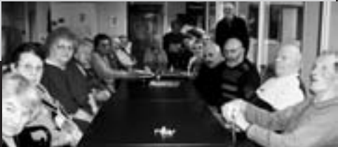
Atelier de lecture à voix haute au centre hospitalier de La Ferté-Macé

Lectures à l'hôpital : dans un souci de s'ouvrir à un public qui n'a pas toujours la possibilité de se rendre librement dans ses locaux, la bibliothèque a mis en place des séances mensuelles de lecture à voix haute. Un thème différent est abordé à chaque séance : l'école, le jardinage, les fêtes... Le but de ces ateliers-lectures est de créer une émulation, de solliciter des échanges et des souvenirs avec les personnes âgées. ■