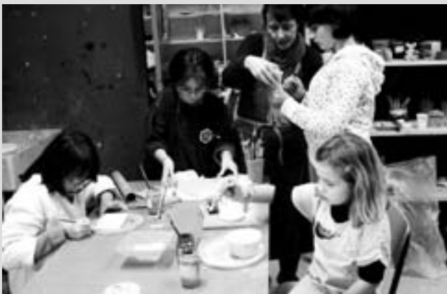
Atelier poterie OFCL, réservé aux 6-12 ans