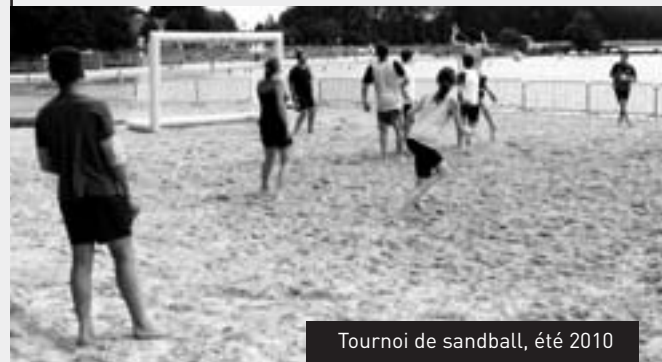
Tournoi de sandball, été 2010

Avec plus de 20 ans d'existence, la base de Loisirs s'affirme comme un lieu attractif, profitant d'un cadre agréable et fréquenté chaque jour par promeneurs et joggeurs.