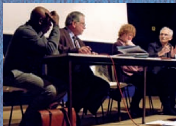
Assemblée Générale de l'Université Inter-Âge (UIA)

(Union nationale des anciens combattants, Association des anciens A.F.N. – F.N.A.C.A, Anciens combattants et prisonniers de guerre, Association des victimes et rescapés des camps nazis, Association nationale des anciens d'Indochine, Le Souvenir Français) participent au devoir de mémoire et sont souvent présentes lors des cérémonies et hommages rendus aux héros des guerres passées.