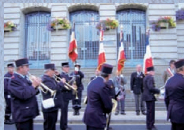
Cérémonie du 14 juillet