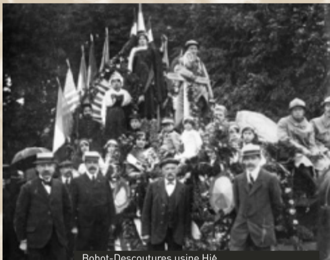
Bobot-Descoutures usine Hié 14 juillet 1919 Char de la Victoire à La Ferté-Macé

Retrouvez le texte intégral sur le site de la ville : www.lafertemace.fr ■