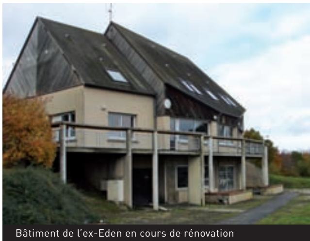
Bâtiment de l'ex-Eden en cours de rénovation