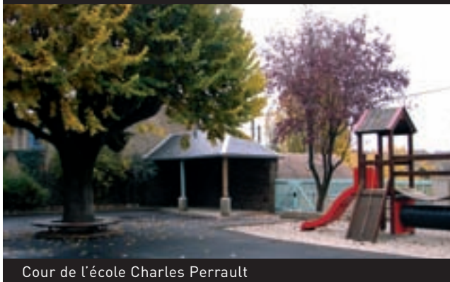
Cour de l'école Charles Perrault