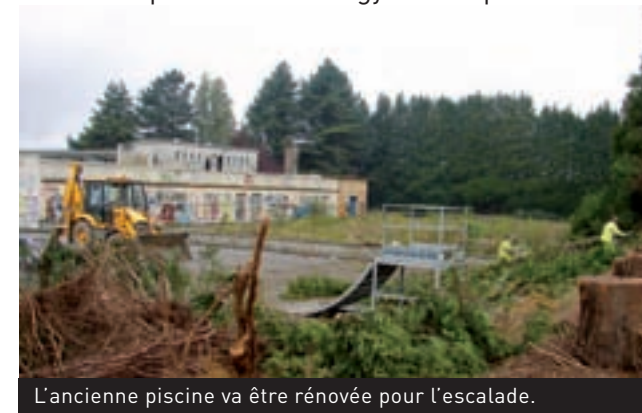
L'ancienne piscine va être rénovée pour l'escalade.