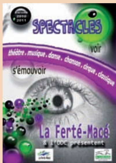
Affiche de présentation de la saison culturelle 2010-2011