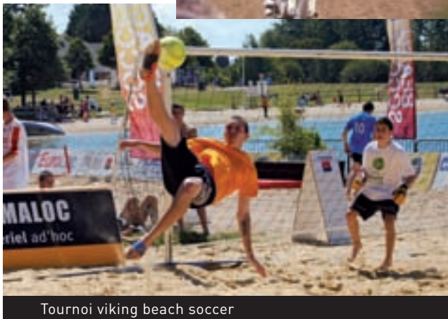
Tournoi viking beach soccer