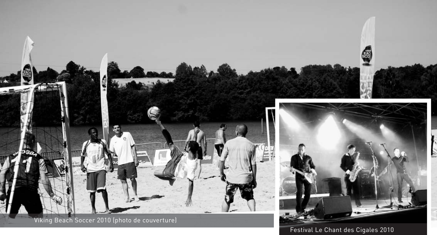
Viking Beach Soccer 2010 (photo de couverture)