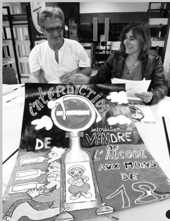
La préparation du concours

Les jeunes ont répondu nombreux et les affiches inventives et percutantes ont parfois été difficiles à départager... Vous pouvez découvrir les affiches gagnantes dans les grandes surfaces participantes. L'ensemble des affiches fera l'objet d'une exposition itinérante dans les établissements scolaires dès la rentrée de septembre. ■