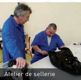
Atelier de sellerie