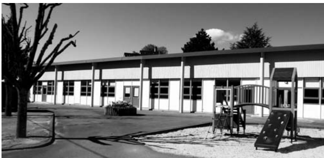
Le multi-accueil va investir les locaux de l'ancienne école Charlie Chaplin en septembre

En décembre dernier, la décision était prise par le conseil municipal d'ouvrir une « Maison de la Petite Enfance » dans les locaux vacants de l'école maternelle Charlie Chaplin .