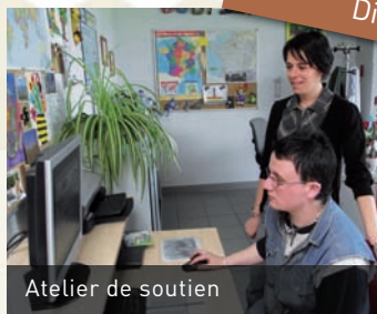
Atelier de soutien

Une quinzaine d'activités professionnelles, supervisées et encadrées par un chef d'atelier et quatre moniteurs d'ateliers sont proposées aux usagers en fonction de leurs capacités.