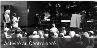
Activité au Centre aéré

Le Plein Air Fertois organise un Centre aéré dont le projet éducatif s'articule autour de cinq objectifs :