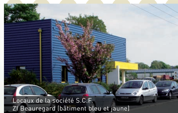
Locaux de la société S.C.F. ZI Beauregard (bâtiment bleu et jaune)

Elle est spécialisée dans les travaux d'électricité, génie climatique, chauffage, ventilation, désenfumage, traitement d'air et d'eau pour : des centres hospitaliers, des cliniques, des centres de soins, des EHPAD, des immeubles de bureau, des industries... Depuis son rachat en octobre 2009, l'entreprise propose de nouvelles prestations : petits travaux, dépannage et maintenance et peut également intervenir sur des travaux d'installation de pompes à chaleur, de production d'eau solaire, installations photovoltaïques chez des particuliers.