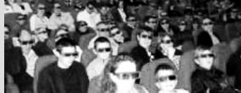
Séance lors du festival de cinéma numérique (avril 2010)

C'est ainsi que le cinéma de La Ferté-Macé présentera des films en numérique et en 3D. Dans les quelques mois qui viennent», nous aurons le plaisir de partager ensemble de belles soirées cinématographiques ! ■