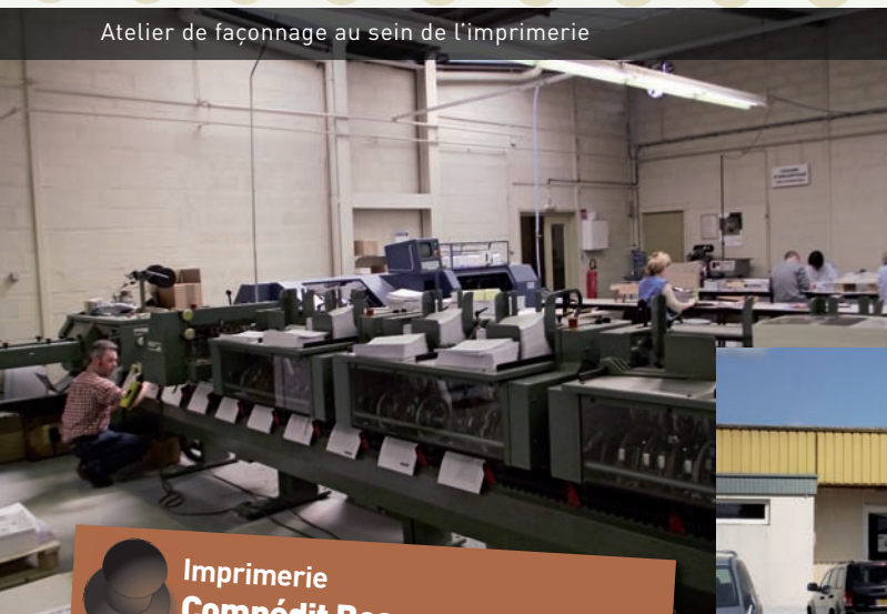
Atelier de façonnage au sein de l'imprimerie