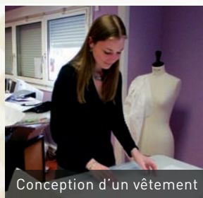
Conception d'un vêtement