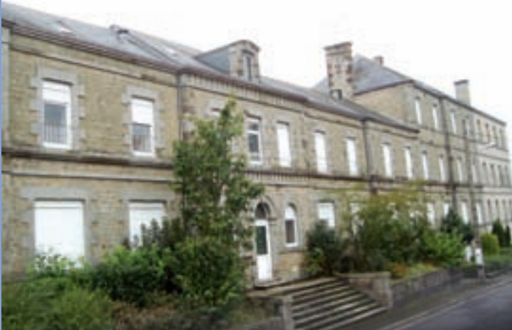
Rue du 14 Juillet