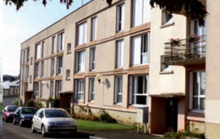
Rue Félix-Désaunay et Faubourg d'Argentan