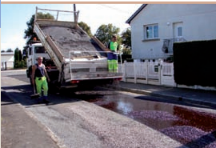
L'équipe municipale de voirie, en ville

Tél. : 02 30 05 05 05 • Courriel : contact@afip-normandie.fr ■