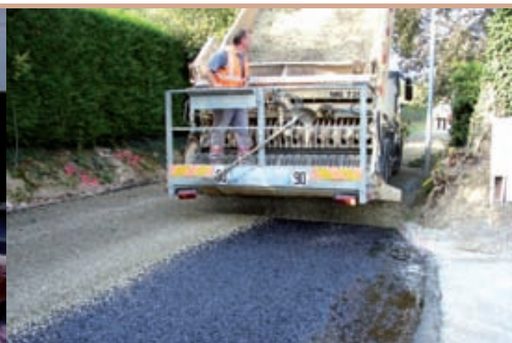
L'entreprise Eiffage, en campagne