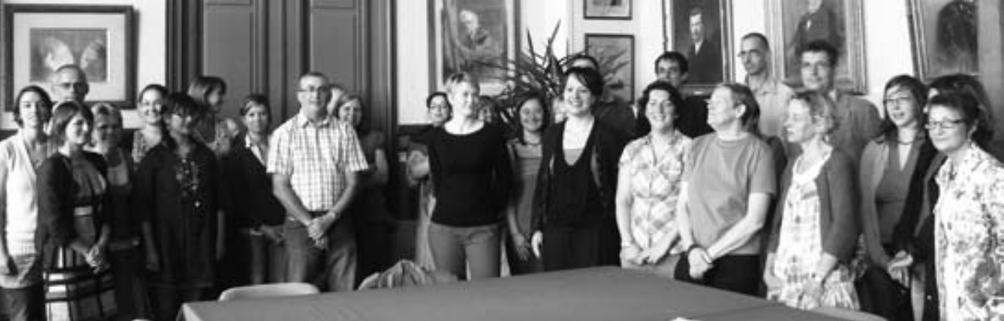
Réception des enseignants à la mairie

Environ cent sportifs, toutes disciplines confondues, ont été cités et récompensés pour leurs brillants résultats. ■