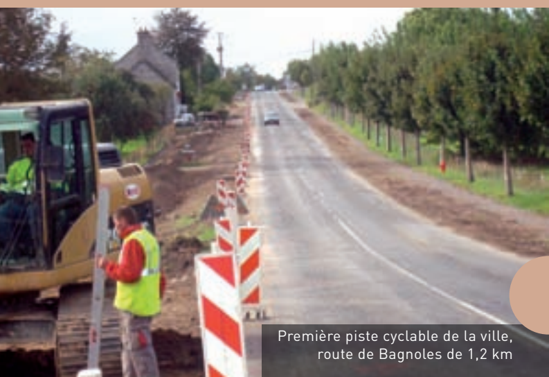
Première piste cyclable de la ville, route de Bagnoles de 1,2 km

La salle d'escalade est installée dans les locaux de l'ancienne piscine. ■