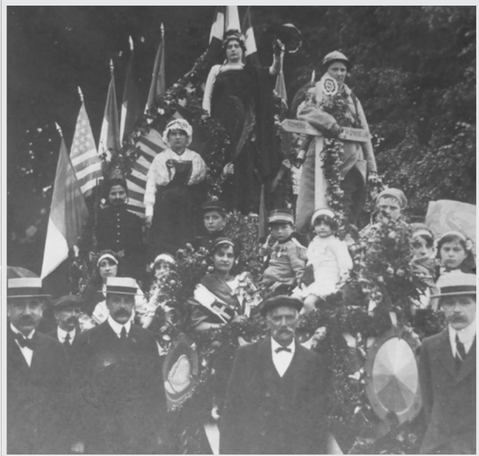
Char de la France et de l'Alsace-Lorraine. Tissage Hié, ex Bobot-Descoutures

Si la taxe d'habitation est établie au nom de plusieurs personnes appartenant à des foyers fiscaux distincts, vous devez additionner les revenus fiscaux de référence concernés. Source : www.impots.gouv.fr