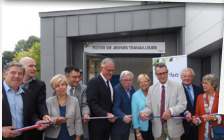
Inauguration du FJT Flers Agglo