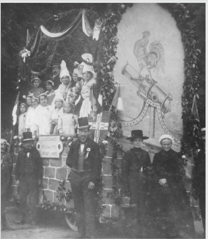
Char des réfugiés du nord de la France. Tissage Salles