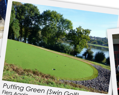
Putting Green (Swin Golf) Flers Agglo