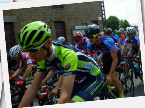
Tour Flers Agglo Départ de La Ferté-Macé