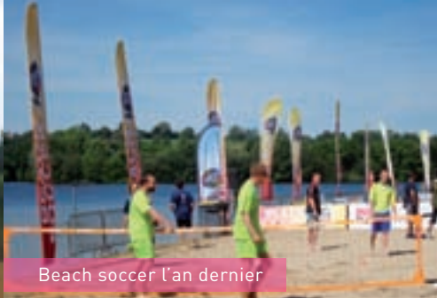
Beach soccer l'an dernier