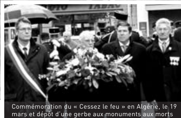
Commémoration du « Cessez le feu » en Algérie, le 19 mars et dépôt d'une gerbe aux monuments aux morts