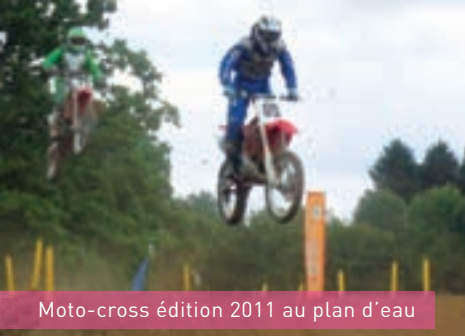
Moto-cross édition 2011 au plan d'eau