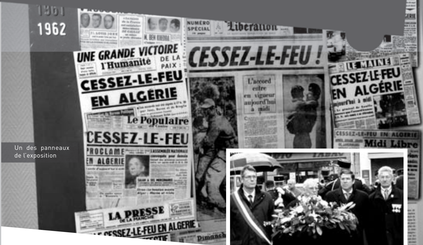
Un des panneaux de l'exposition

M. Le Maire et son équipe municipale présentent leurs plus sincères condoléances aux familles et amis.