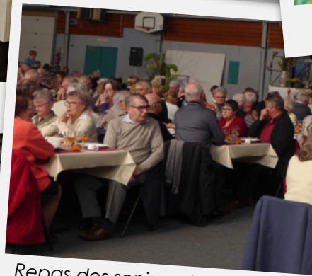
Repas des seniors, 450 convives