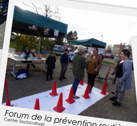
Forum de la prévention routière Centre Socioculturel