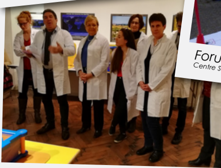
Semaine de la science infuse