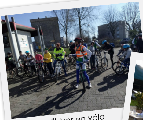
Balade d'hiver en vélo Centre Socioculturel - Partenariat Cyclo Club Fertois