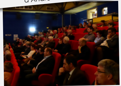
Cérémonie des vœux à la population