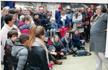
Les Andain'ries. Martintouseul