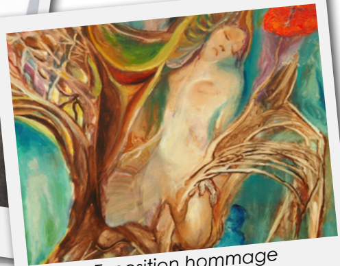
Exposition hommage à André Helluin