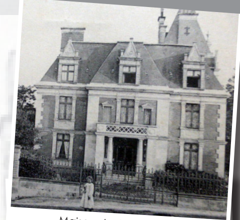
Maison de Clovis Salles