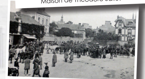
Le marché aux chevaux