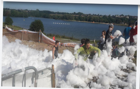
L'Incendiaire, acte VII