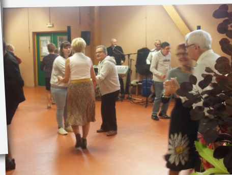
Thé dansant organisé dans le cadre de la semaine bleue