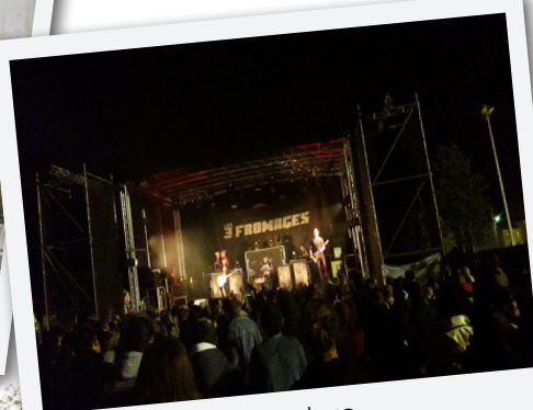
Festival La Revoy'ure