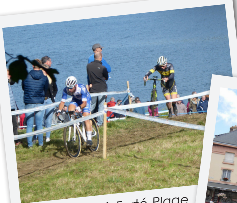
Cyclo Cross à Ferté-Plage