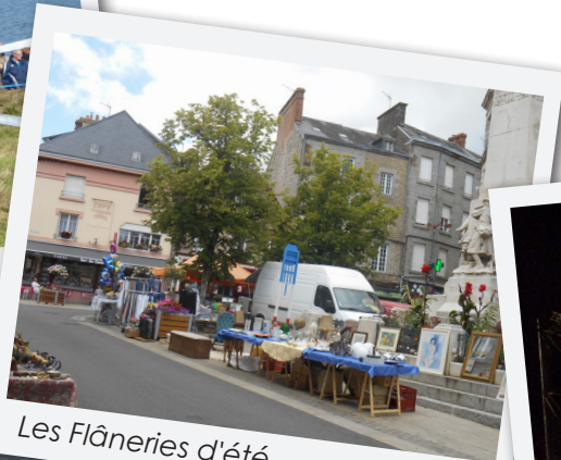
Les Flâneries d'été