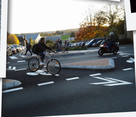
Inauguration des pistes cyclables