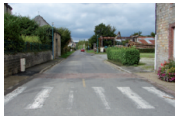
Rue de La Forge

À Saint-Michel-des-Andaines, notre équipe de voirie est intervenue pour une reprise complète de la rampe d'entrée au cœur de la commune. La rue de la Forge, sortie vers La Sauvagère, fera l'objet d'aménagements urbains jusqu'au panneau marquant l'entrée du bourg. L'entreprise est d'ores et déjà retenue pour un début de travaux dans les prochaines semaines. ■