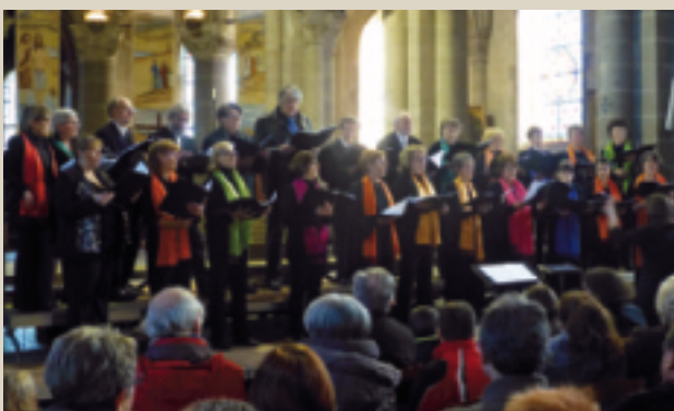
Concert Chorale OLÉNA. ■