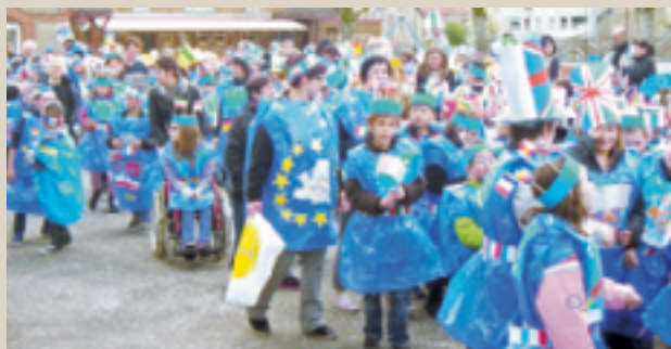
Carnaval des écoles. ■