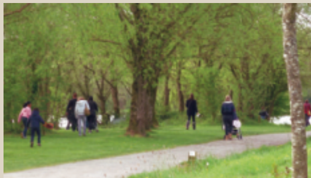
Chasse aux œufs. ■