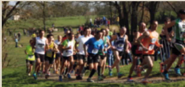
Course de Printemps du Jogging d'Andaine. ■