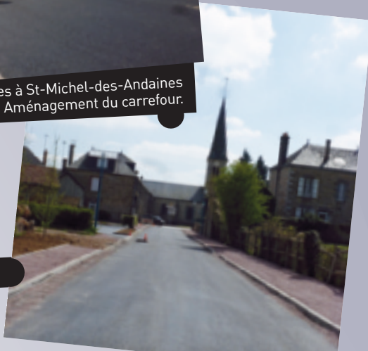
Rue de La Forge