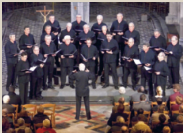
Concert OLDARRA (en collaboration avec l'Association pour la restauration de l'Église). ■