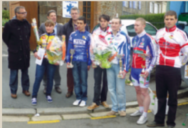
Prix de la municipalité (Vélo Club Fertois). ■