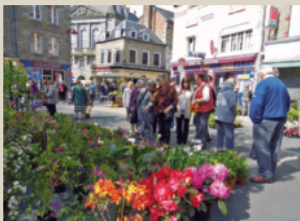
Marché aux fleurs organisé par l'UCIA. ■