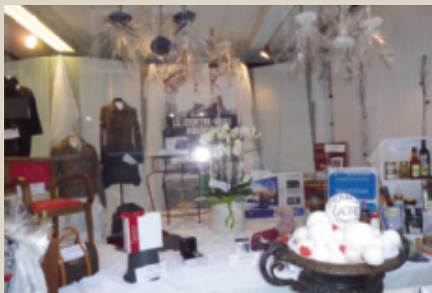
Inauguration du centre ville et Gagnez la vitrine photo (en collaboration avec l'UCIA). ■