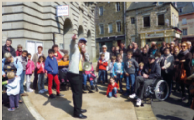
Déambulation organisée par Les Andaineries en collaboration avec la Ville et l'UCIA. ■