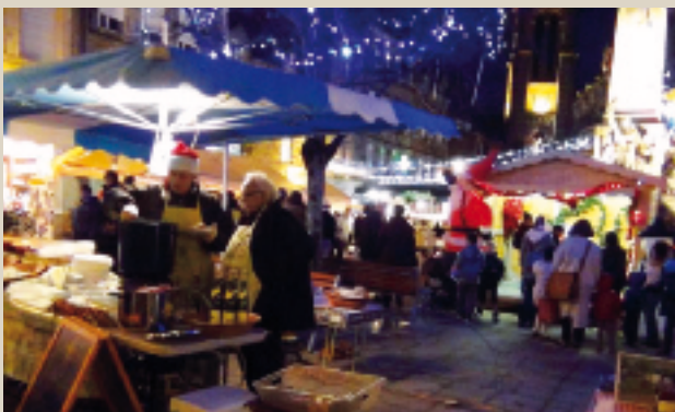
Marché de Noël (UCIA) et marmite des familles (Association des Familles). ■