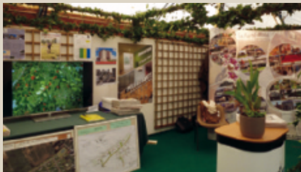
26 e Salon de l'Habitat. ■