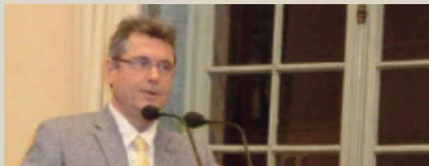
Présentation des vœux à la population. ■