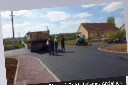
Le Gué aux Biches à St-Michel-des-Andaines Aménagement du carrefour.

Les travaux achevés fin avril ont laissé la place à une rue aménagée d'environ 500 m. Des ralentisseurs et chemin piétonnier sur les trottoirs permettent de circuler en toute sécurité. Un côté de trottoir a été aménagé pour permettre aux personnes à mobilité réduite de circuler. Un aménagement paysager agrémentera l'entrée du village. ■