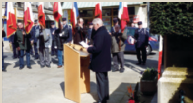
Commémoration du Cessez-le feu en Algérie. ■