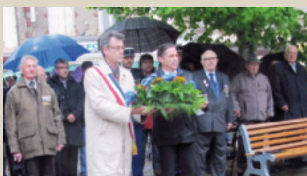
Commémoration de l'Armistice du 8 mai 1945. ■