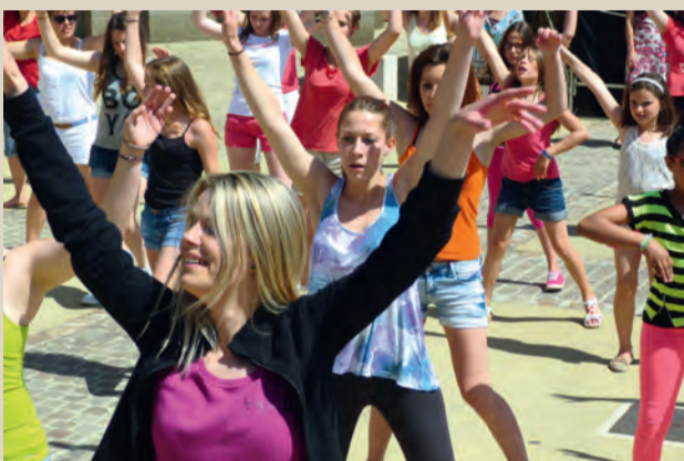
Fête de la musique. ■