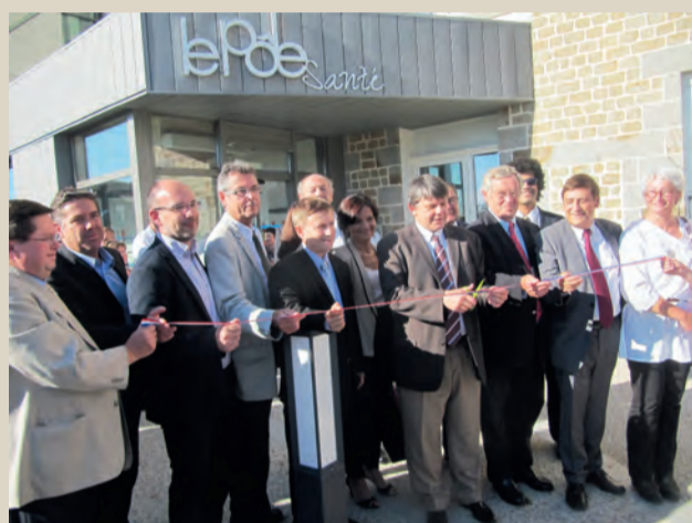
Inauguration du Pôle Santé. ■