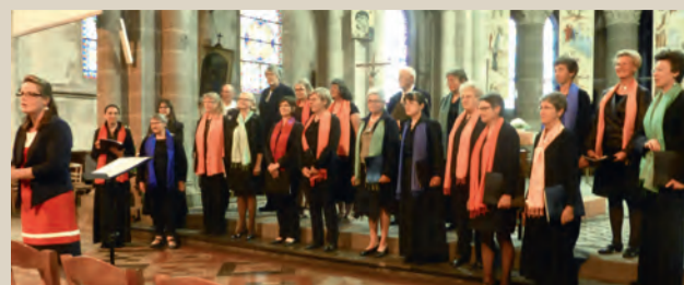
Concert de la chorale Oléna dans l'église Notre-Dame.