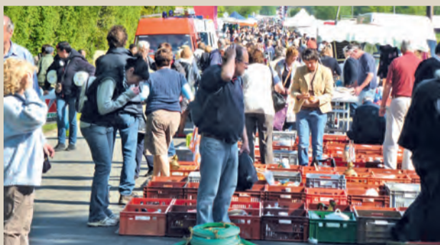
Vide-grenier à Saint-Michel des Andaines. ■