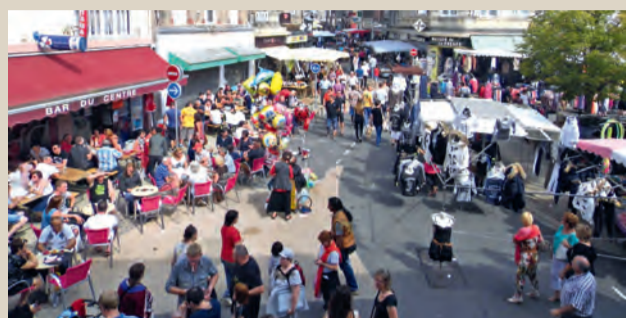
Braderie organisée par l'UCIA. ■