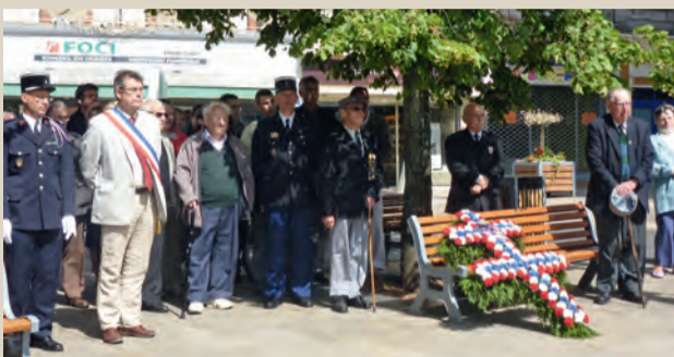
Cérémonie de l'Appel du 18 juin. ■