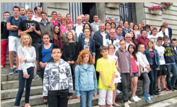
Réception des sportifs en mairie. ■