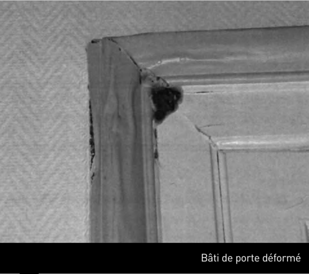
Bâti de porte déformé

La Mérule (ou le mérule) est un champignon qui s’attaque aux bois et cartons dans les pièces humides de nos maisons. Il est très résistant.