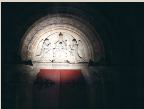
Pierres et Lumières. ■