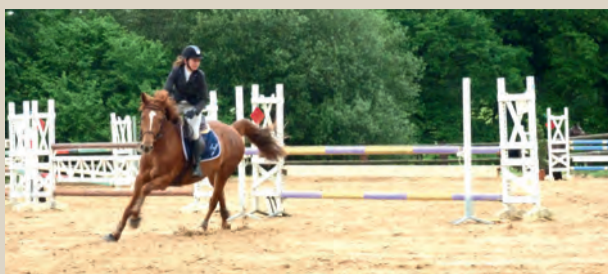
Concours hippique au poney-club de la Péleras pour la qualification au championnat de l'Orne. ■