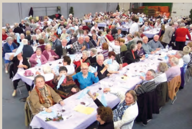
Repas des plus de 70 ans. ■

ECONOMIES D'ENERGIE - DECORATION - JARDIN - INTERIEUR