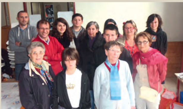
Fête des voisins. ■