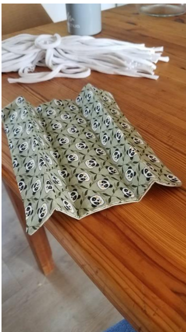
Les plis (1)