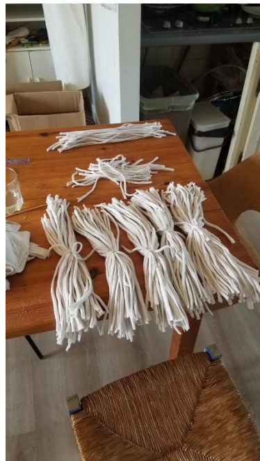
Les liens (2)