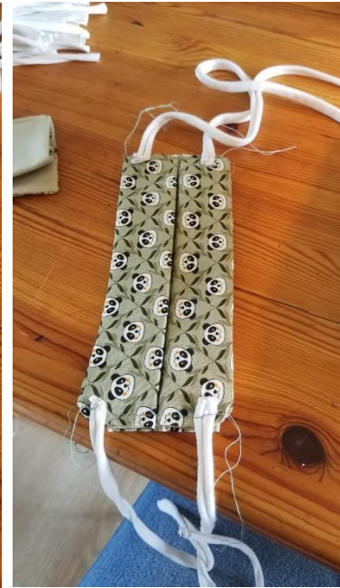
Face interne (3)